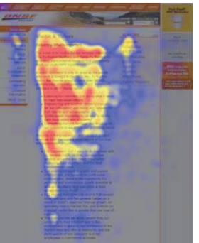
ホームページでの視線の経路をビジュアル化した画像

色々検証した結果Fパターン目線の流れで情報を探していることが調査の結果分かりました。※図は目線の流れを表したものです。チラシなどを読む目線はZラインで動くといわれていますがホームページではFパターン目線で流れるそうです。協会のホームページはタイトルバナーとナビメニュー（横の流れ）、左のメニュー（縦の流れ）、そして（真ん中の横の流れ）コンテンツ上部に重点を置いた、シンプルで見やすい・きれい・求める情報が探しやすいFライン構造になっています。