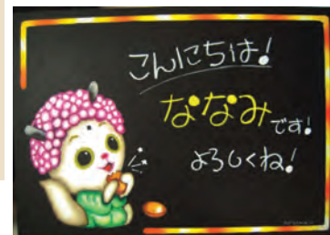
取材中に説明しながら一部を制作し、その後仕上げ(塗りは約1時間半)完成品はスタジオで紹介されました。

チョークアートも街でかなり見かけるようになりました。アートとしてだけでなく、POP広告として強力な集客効果・入店効果があると思います。今回はいい経験になりました。これからも大好きな奈良で、POP広告とチョークアート、両方活かして頑張っていこうと思っています!